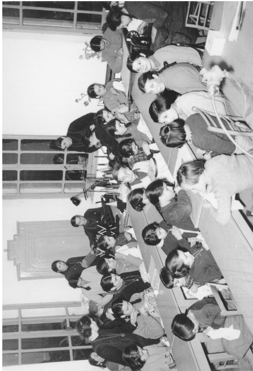
Ponton di Domegliara - anni Cinquanta. Sotto lo sguardo materno di alcune sorelle della Congregazione, un bel gruppo di allieve attende a lavori di ricamo e cucito